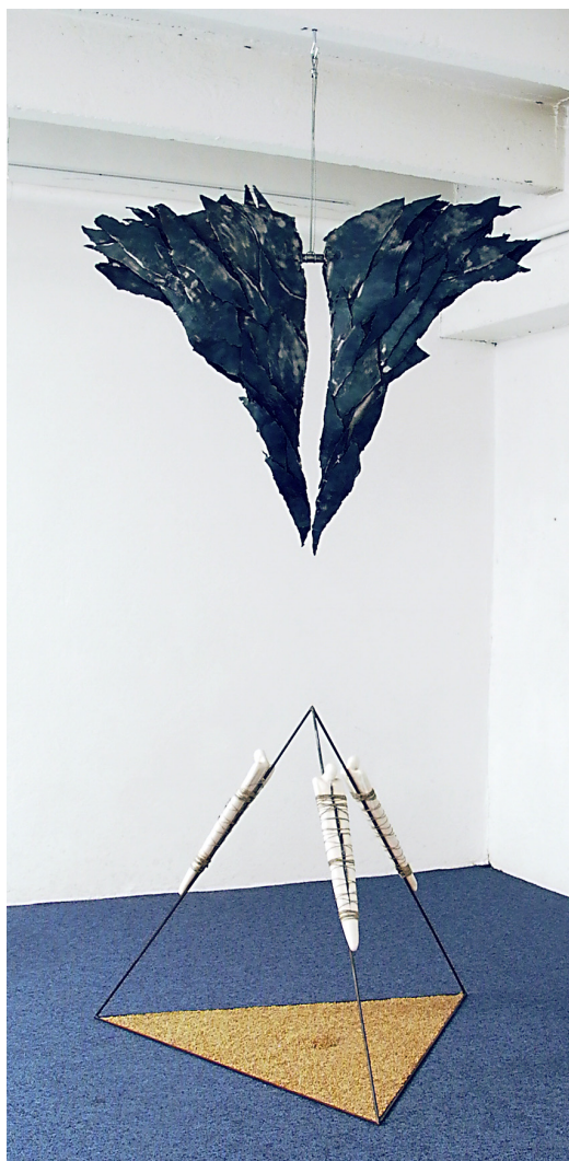
Plume de plomb, 200 x 100 x 100cm, Acier et céramique - 1998