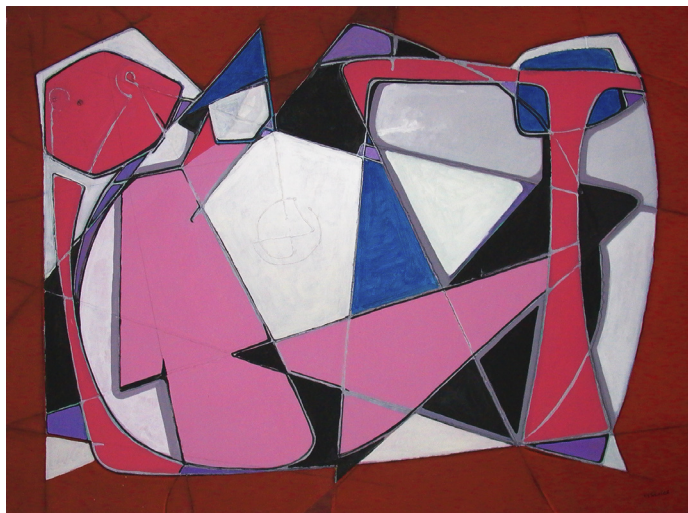
Mathias 130 x 170cm, acrylique sur toile - 1994

www.l-artquarium.ch/galerie/mathiasRusch2.html