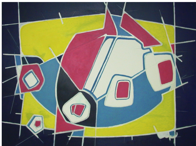
Sarah 130 x 170cm, acrylique sur toile - 1994

L'ARTQUARIUM ATELIER DE PEINTURE ESPACE DE CRÉATION